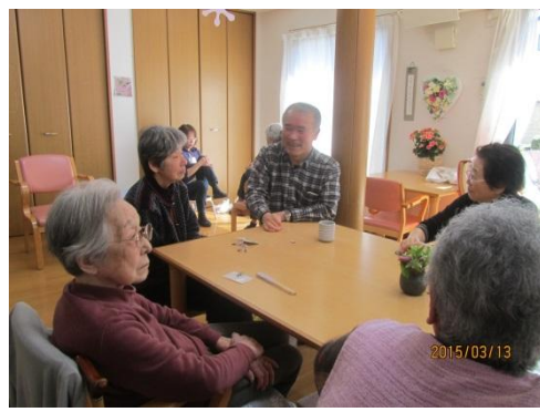
お話や歌に花がさきます。