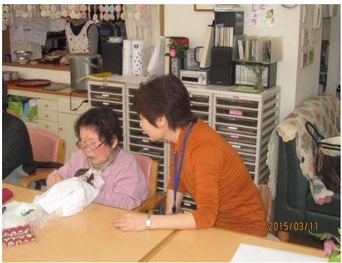
「がんばってますね。」