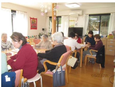
一緒にクロスワード