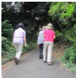
散歩も機能訓練です♪