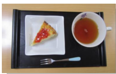
手作りケーキと紅茶でおやつ

4月からお食事費（昼食&おやつ代）を値上げすることにしました。安心・安全な食材にこだわっていますので、厳しい状況になっていたこともあり、値上げをさせていただきました。