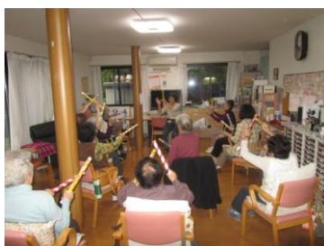
<午後の体操に棒体操を取り入れる日も>

☆花りん体操について「もう少し時間があれば延長して欲しい」とのコメントもありました。