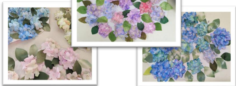
紫陽花はグラデーションになるように和紙を染めました

花りんの庭には5月は藤の 花、モッコウバラ、6月には 真っ白な紫陽花が咲き、フ アの壁にはご利用様と一 緒に作った紫陽花が美しく 咲きました。