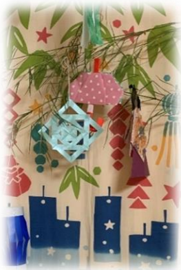
色とりどりの七夕飾り