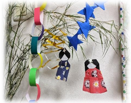
折り紙ボランティアさんと作った織姫と彦星