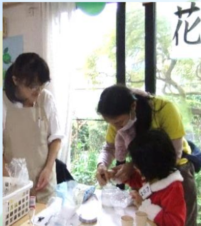
アロマのバスボム作り