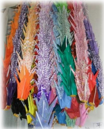
県の戦没者追悼式に献納

昼食後は テレビ鑑賞、歌、塗り絵、 おしゃべり、静養や 時にはお散歩など 思い思いの時間を 過ごされています。 もともと手仕事をお好きな 方が多く、おしゃべりを 楽しみながら素敵な作品が 次々と生まれています。