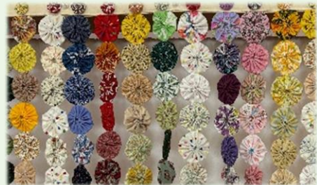
公益財団法人 成建福祉財団 https://www.seikenzaidan.or.jp

長年使ったキッチンが傷んだため、成建福祉財団の助成金で改修を行いました。明るく快適になり、利用者さんと一緒に作ったヨーヨーキルトの新しい暖簾が彩りを添えます。