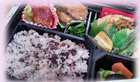
お赤飯弁当。ワーカーズ仲間のW.Coミズキャロット https://www.ms carrot.com