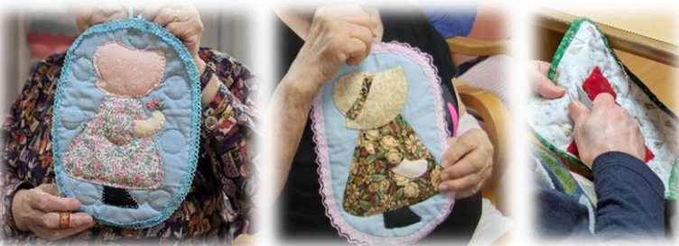
色違いスーちゃん。12月はクリスマスモチーフも