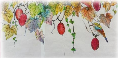
塗り重ねが生む 色鉛筆の深み

〒244-0811 横浜市戸塚区上柏尾町244番地 TEL 045-828-1251 FAX 045-828-1252 Email: daykarin@sunny.ocn.ne.jp